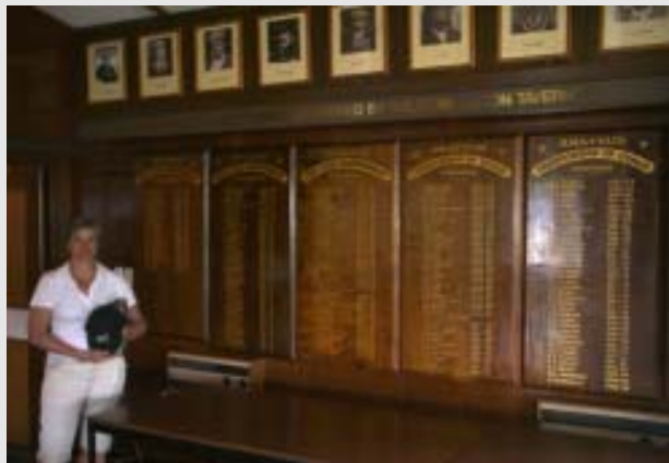
Otago Golfklubin vanhat mestarit

Paikan ystävällinen caddiemasteri neuvoi meitä ajamaan Wanakaa päin. Hänen mielestään matkalla kannattaa tutustua Ban-nockin viinialueeseen ja syödä lounasta Mt. Difficultyn terassilla, josta on hienot näkymät viinilaakson yli. Matka jatkui Wanakaan, joka sijaitsee Wanaka-järven eteläkärjessä. Hyvin kaunis pikkukaupunki ja talvisin hiihtoalueet ja laskettelurinteet ovat ihan lähellä Mt. Aspiring:n alueella. Wanakan Golf Club greenfee 50 NZ$, (noin 28 euroa),