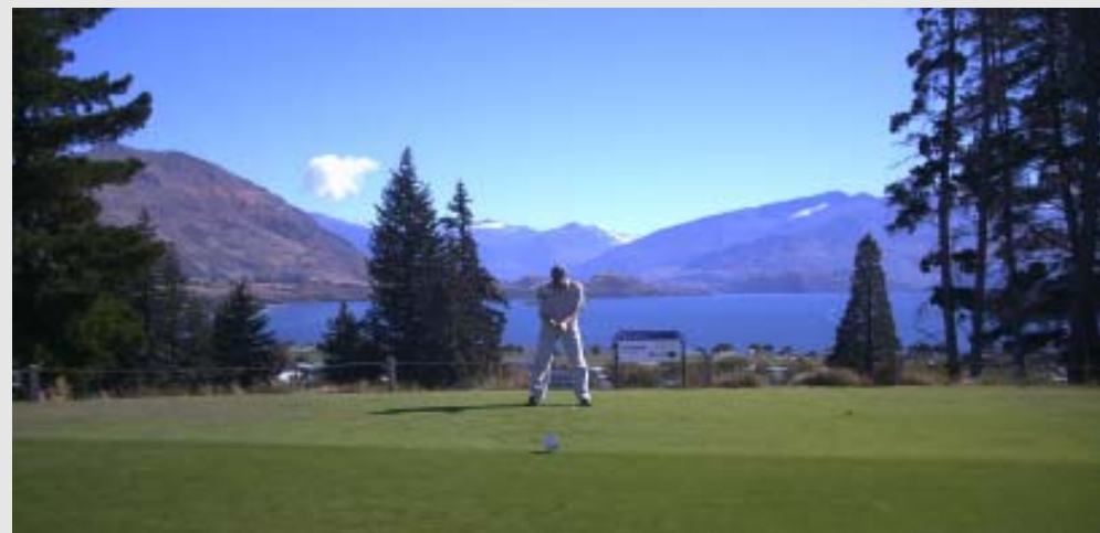
Wanakan upeat maisemat

on metsäinen puistokenttä, par 70 miehille, 71 naisille. Täällä oli miesten klubipäivä ja jouduimme odottamaan puoli tuntia ennen kun saimme lähteä. Ensimmäisellä puolikkaalla oli mahtavat näkymät järven yli ja taustalla näkyi jopa lumipeitteisiä vuoren huippuja. Peli sujui hyvin, mutta toisella puolikkaalla jäimme klubipäivän pelaajien taakse ja jouduimme hieman odottamaan. Tämäkin kenttä oli hyvässä kunnossa ja mukava pelata.