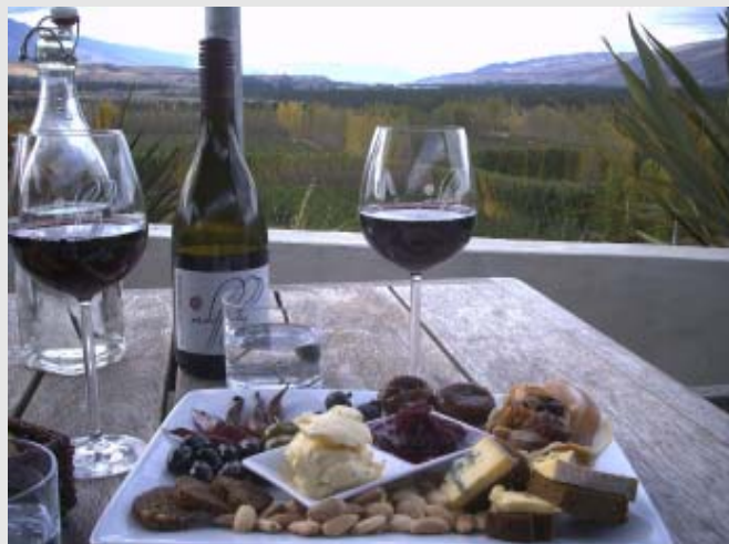
Mt. Difficultyn terassilounas

on metsäinen puistokenttä, par 70 miehille, 71 naisille. Täällä oli miesten klubipäivä ja jouduimme odottamaan puoli tuntia ennen kun saimme lähteä. Ensimmäisellä puolikkaalla oli mahtavat näkymät järven yli ja taustalla näkyi jopa lumipeitteisiä vuoren huippuja. Peli sujui hyvin, mutta toisella puolikkaalla jäimme klubipäivän pelaajien taakse ja jouduimme hieman odottamaan. Tämäkin kenttä oli hyvässä kunnossa ja mukava pelata.