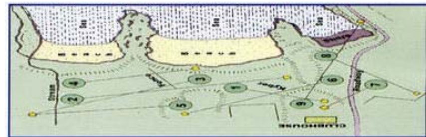
Otwayn kenttäkokonaisuus saattaa tuntua nykypäivän mittareilla mitattuna vähän erikoiselta.